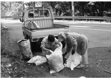
県境に捨てられていたゴミも処分しました