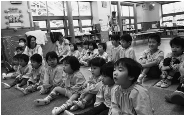
何がはじまるのかな？ マジックショーに興味津々！

もし、自分で判断を迷うことがあれば、駐在所や家族・親戚・知人に相談してください。