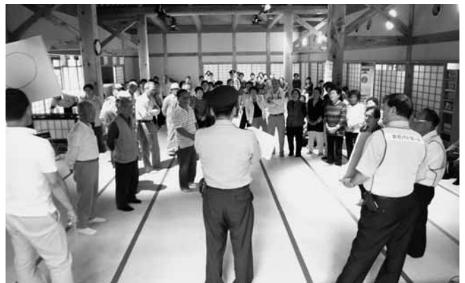
○×クイズに挑戦！（高齢者サロンにて）