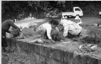
県境の植栽の様子