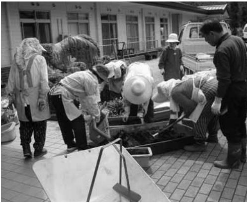
いこいの郷での作業風景

このあと、いこいの郷でも花の植え替え作業を行いました。いこいの郷では、入居者の皆さんが毎日の水遣りしながら、時には窓