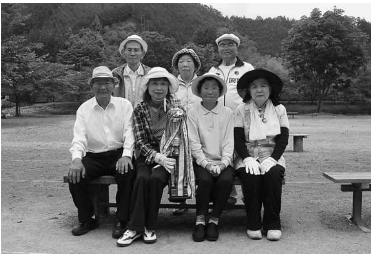
優勝した池原チーム

参加チームを2ブロックに分け予選リーグを行い、各ブロックの1位が決勝を行い、「池原チーム」が昨年に引き続き見事優勝に輝きました。